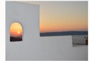
Solnedgang fra en af de mange terrasser