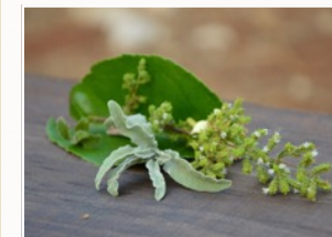
Kretas skatkammer * Helbredende urter