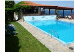
Svømmebasin med udsigt

Fælles for os er at vi erfarer livet som en magisk forvandlingsrejse og at alt hvad vi møder giver nye bevægelser i vores liv. Vi glæder os til at møde dig.