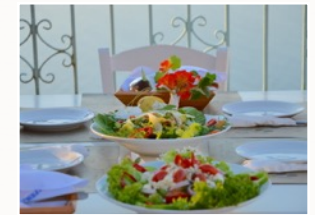
Spis mildhed til alle måltider